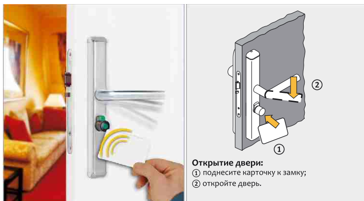
Открытие двери: ① поднесите карточку к замку; ② откройте дверь.

Ключами к дверям служат чипы, с записаной на них информацией. Они легко перепрограммируются, и могут служить не только для открытия доступа, но и выступать платежным средством (например на парковке). Поскольку чип работает по бесконтактной технологии он практически не изнашивается.